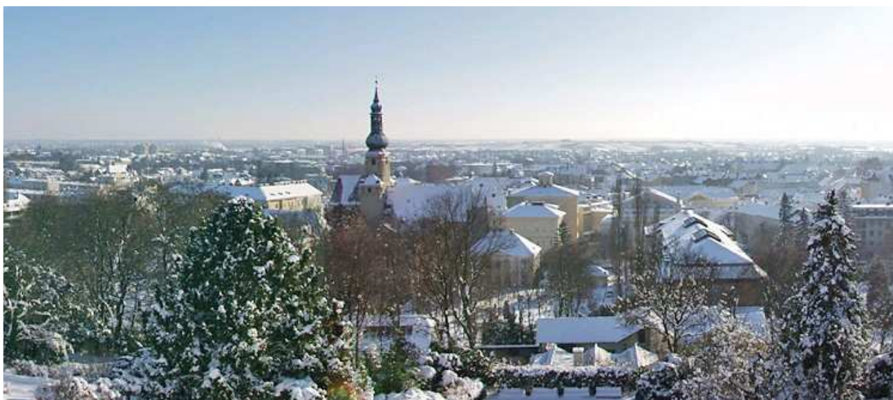
Blick vom Kurpark auf Baden

www.baden.at/virtueller_Rundgang/tour_baden.html