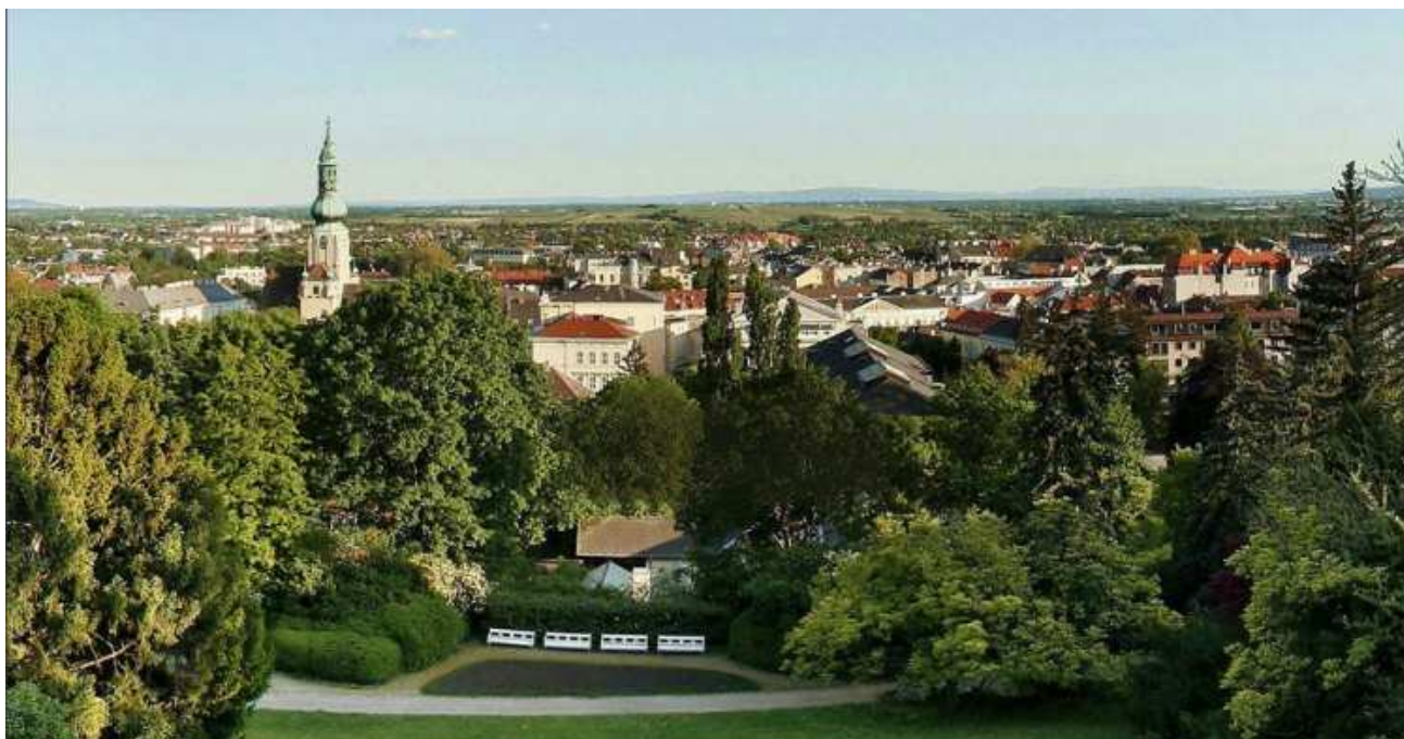
Blick vom Kurpark auf Baden